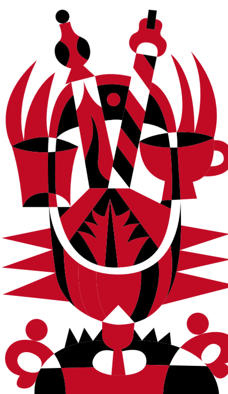
TIRAMI SU MARTINI