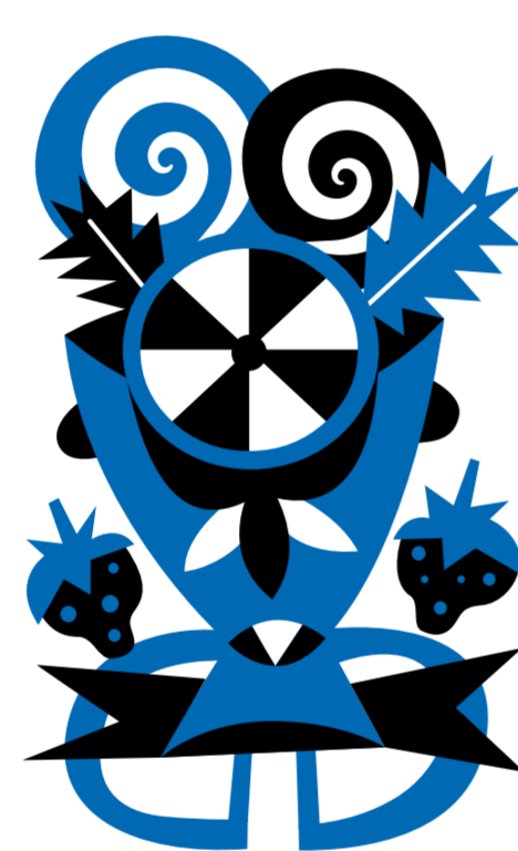
COME UNA NUVOLE