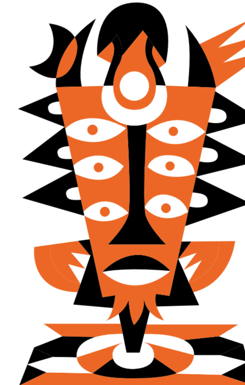
DIAVOLO IN TONICA NERA