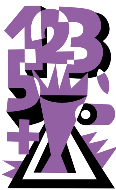
SENATO DELLA DIGESTIONE