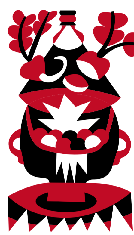
LATTE ALLA LUCE VERDE