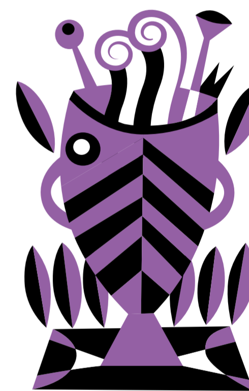
LE GRANDI ACQUE